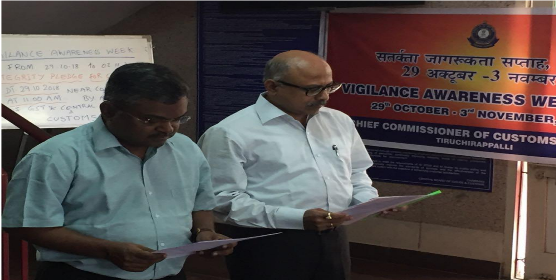
सतर्कता जागरूकता सप्ताह के दौरान 29/10/2018 को शपथ दिलाते हुए सीमा शुल्क आयुक्त श्री अशोक एवं जीएसटी आयुक्त श्री जे.एम. केन्नडी