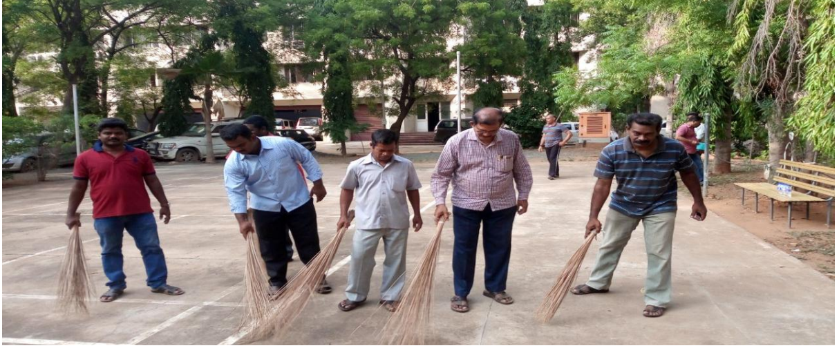
स्वच्छता की ओर हर कदम - कार्यालय की सफाई में लगे अधिकारी